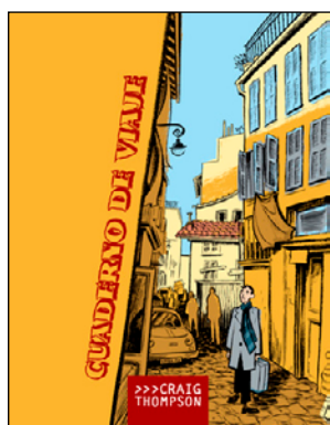
Cuaderno de viaje 2.ª edición 224 páginas. 18 euros ISBN: 978-84-935229-3-3