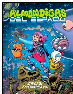
Almóndigas del espacio 2.ª edición 672 páginas. 39 euros ISBN: 978-84-15163-29-9