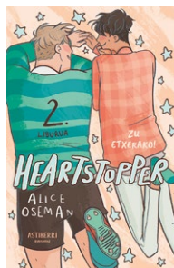
Heartstopper 2. Zu etxerako! 320 orrialde. 17 euro ISBN: 978-84-10332-09-6