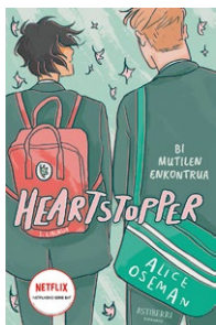
Heartstopper 1. Bi mutilen enkontrua 288 orrialde. 17 euro ISBN: 978-84-10332-08-9

ALICE OSEMAN (Kent, Ingalaterra, 1994) komikigile saritua da, idazlea, ilustratzailea eta gidoilaria. Bera da Heartstopper komikisailaren sortzailea. Sei alek osatzen dute saila, bertan LGBTQI+ giroko erromantzeak lantzen dira irakurle nerabeentzat, eta dagoeneko hamar milioi kopia baino gehiago saldu dira munduan eta 39 hizkuntzatarantz itzuli dituzte. Oseman bera aritu da Netflixentzat egindako ikus-entzunezko egokitzenaren gidoilari eta ekoizle. Osemanen liburuek hainbat sari irabazi dituzte edo hainbat saritarako aukeratu eta izendatu dituzte, besteak beste, YA Book Prize, Inky Awards, Carnegie Medal eta Goodreads Choice Awards sarietarako. Euskaraz, Heartstopper -en lehen lau liburuak 2024an eta 2025ean argitaratu ditu Astiberrik. Azken biak, bosgarrena eta seigarrena, 2026an argitaratzea aurreikusten da.