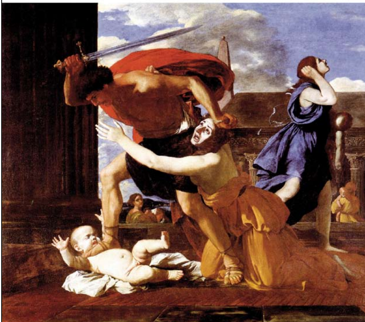
MUJER HACIÉNDOSE LA LOCA ANTE UN PARRICIDIO Femme pretendé parler on le telephone, Nicolas Poussin.