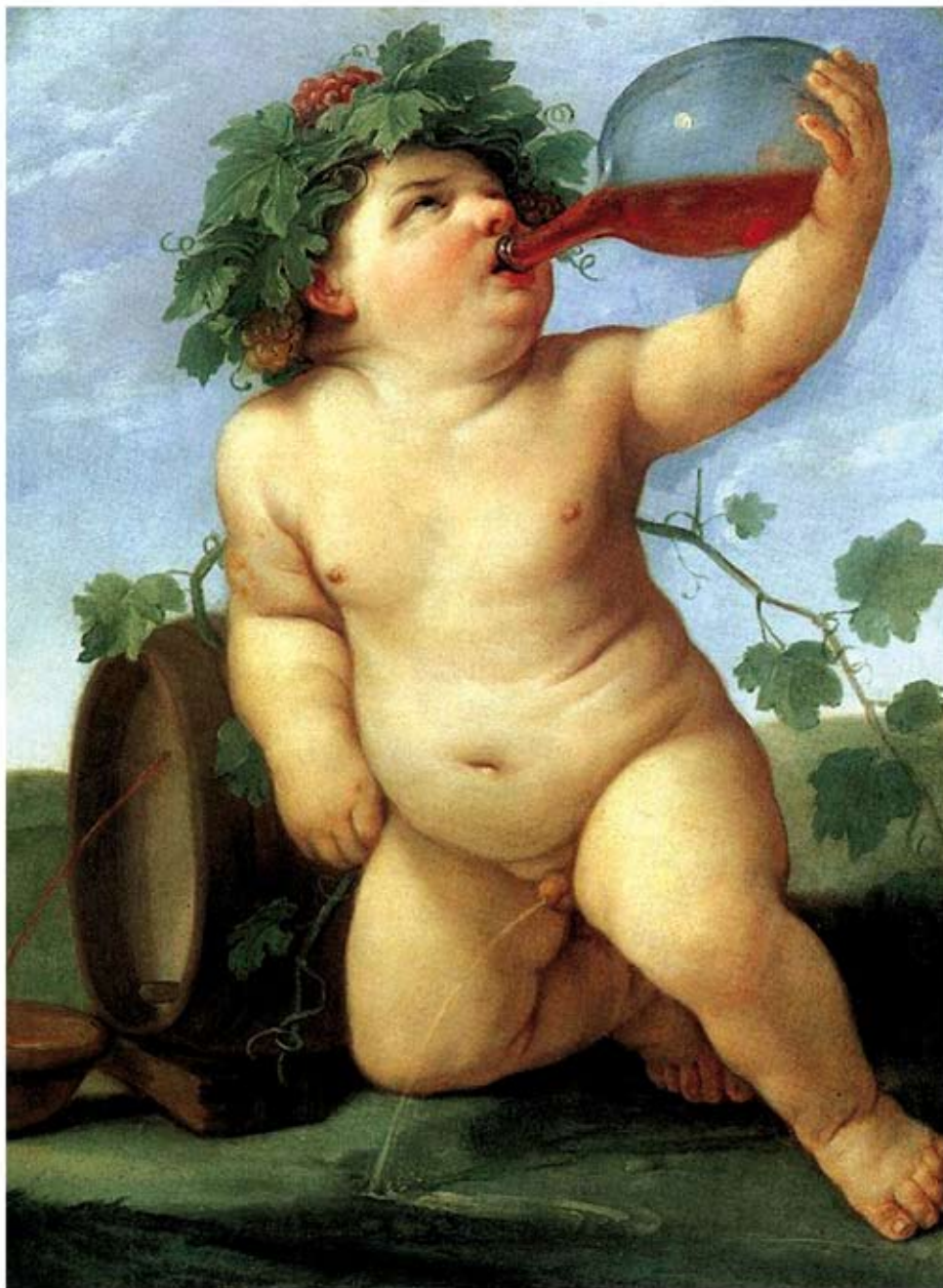
JUVENTUD SIN VALORES Il bambino alcolicci, Guido Reni.