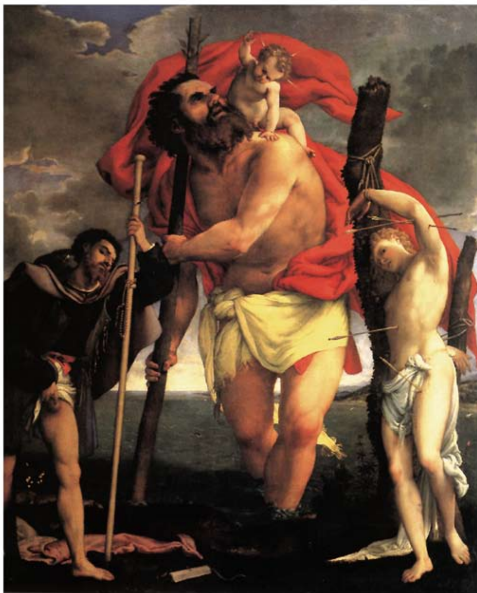
ULTIMATE X-MEN Il Equipo Di Superheroi Biblicco, Lorenzo Lotto.