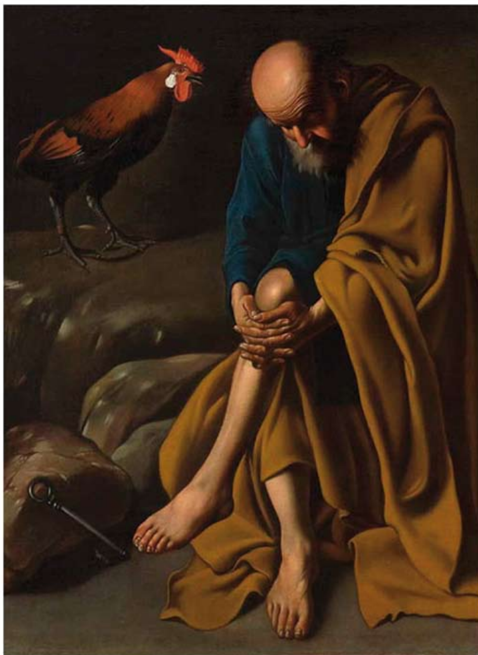
LA GALLINA PSICÓLOGA Juan Bautista Maíno.