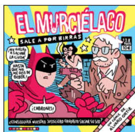
El Murciélago sale a por birras 2.ª edición 128 páginas. 10 euros ISBN: 978-84-18215-12-4