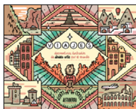
Viajes 312 páginas. 18 euros ISBN: 978-84-16251-81-0