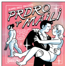
PRDRO y MAILI 208 páginas. 14 euros ISBN: 978-84-18215-66-7