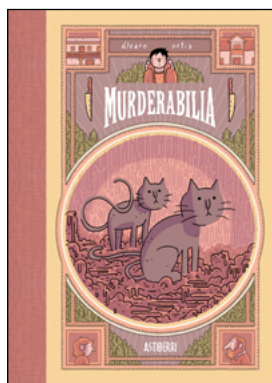
Murderabilia 2.ª edición 112 páginas. 16 euros ISBN: 978-84-15685-73-9