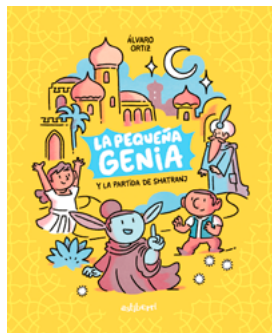
La pequeña genia y la partida de shatranj 168 páginas. 18 euros ISBN: 978-84-18909-11-5