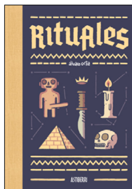
Rituales 128 páginas. 17 euros ISBN: 978-84-16251-32-2