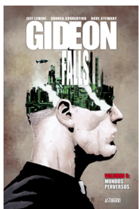
Gideon Falls 5 Mundos perversos 120 páginas. 16 euros ISBN: 978-84-18215-62-9