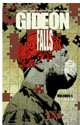
Gideon Falls 4 El pentáculo 128 páginas. 16 euros ISBN: 978-84-18215-21-6