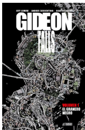
Gideon Falls 1 El granero negro 2. a edición 160 páginas. 18 euros ISBN: 978-84-17575-28-1