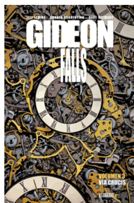
Gideon Falls 3 Vía crucis 2. a edición 136 páginas. 16 euros ISBN: 978-84-18215-00-1