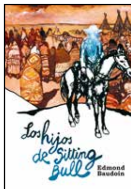
Los hijos de Sitting Bull 96 págs. 17 euros ISBN: 978-84-15685-66-1