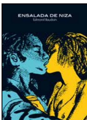
Ensalada de Niza 264 págs. 20 euros ISBN: 978-84-92769-55-1