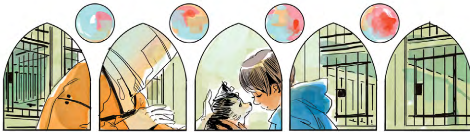
Año 5, colonia de Irzah - El chico y su perro