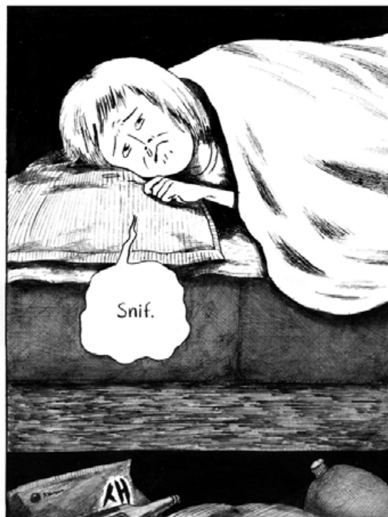
Patatas fritas de gambas. Soju. Limonada