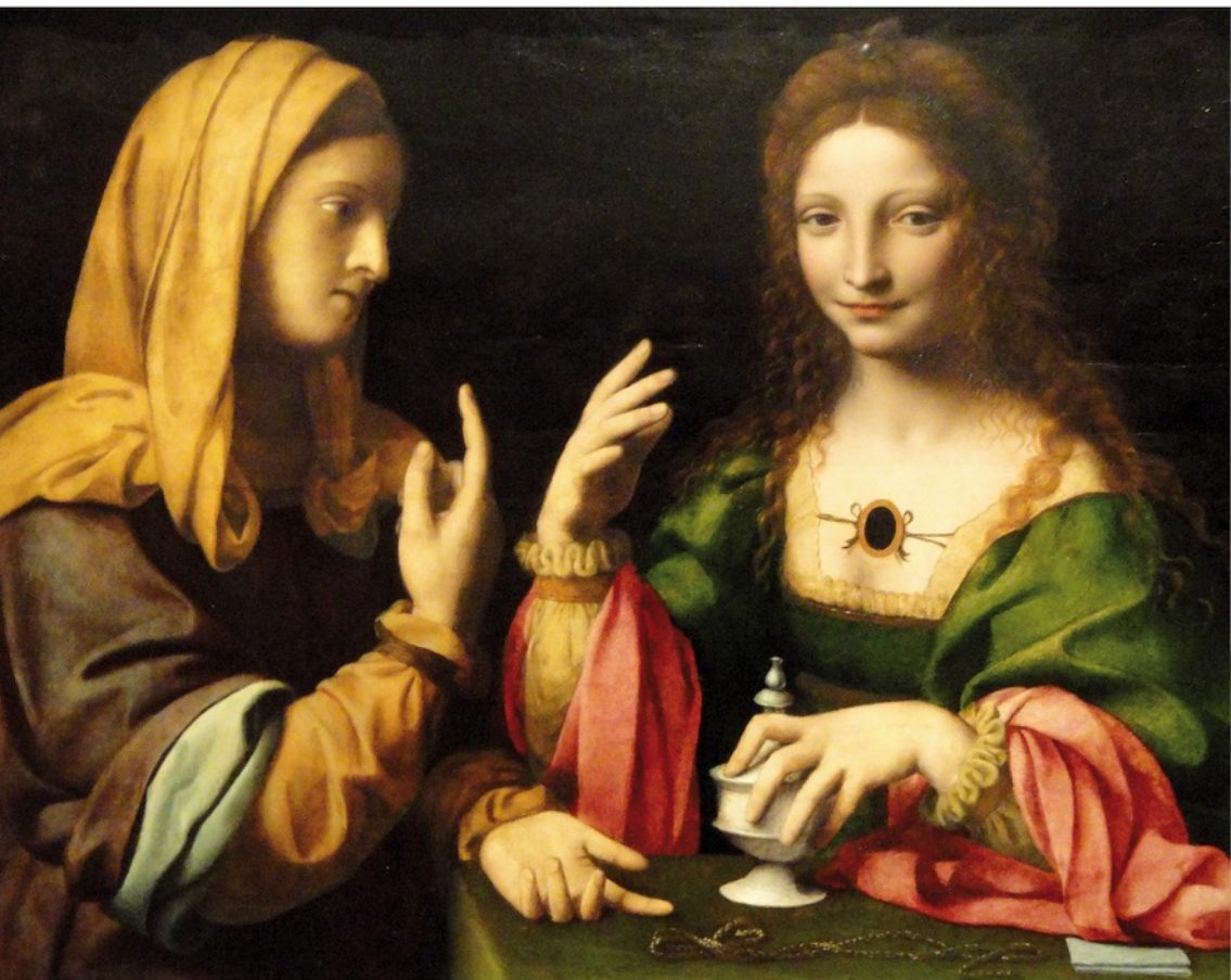
SEÑORA EXPLICANDO SU TRAQUEOTOMÍA Il postoperatori appacibili , Bernardino Luini.