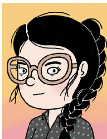
Autorretrato © Elisa Riera

Una nueva y chispeante propuesta autobiográfica de Elisa Riera tras El futuro es brillante (Astiberri, 2019).