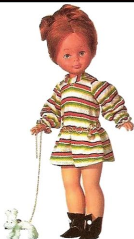
CONJUNTO DE OTOÑO (N° 15). Alegre, pero sencillo traje de punto, ceñido al talle por un moderno cinturón de anillas, y unos botines a juego.