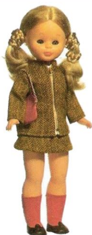
EN LA UNIVERSIDAD (N° 7). Ligero conjunto de falda y chaquetón sport. Medidas cortas y bolso.