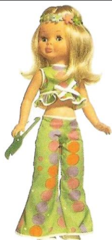
EN EL JARDIN (N° 4) Veraniego conjunto que consta de pantalón largo, chaquetilla corta, diadema de flores y tijeras de podar.