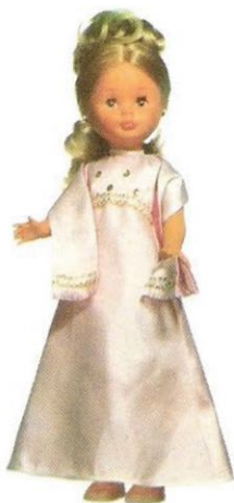
PUESTA DE LARGO (N° 19). Traje de noche, echarpe y bolso de raso blanco a juego, ilusión de toda jovencita.