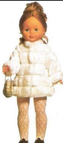
NOCHE DE ESTRENO (N° 21). Abrigo de visón último modelo, con complemento de collar de perlas y elegante bolso.