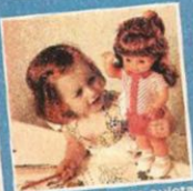
Estate quieta con las manitas que no me dejas dibujar

Marujita es una muñeca muy especial. Porque, como ya sabéis andar y mover los bracitos ella solita, nunca está quieta. Marujita es la más traviesa de tus muñecas. La más traviesa de tus amiguitas. Cuidala que para eso eres mayor.