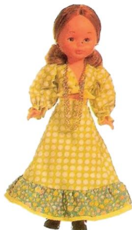
MAXI HUNGARA (N° 17). La atrevida y alegre moda húngara no puede fallar en un moderno guardarropa ni un collar tampoco.