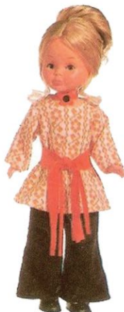
CONJUNTO LOCO LOCO (N° 28). El más adecuado conjunto para reuniones Hippies. Con él Nancy podrá bailar el más movido de los ritmos.