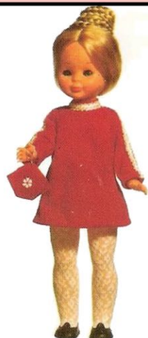
DE TARDE (N° 13) Auténtica creación compuesta por traje con pasamanería dorada, bufanda y bolso a juego.