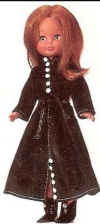
MAXIABRIGO (N° 18). Atrevido abrigo largo, confeccionado en fieltro, con adorno de botones; lo complementa una bufanda, también de fieltro, a juego.