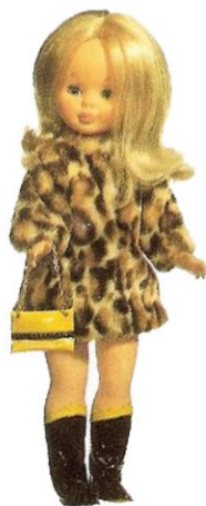
EN LAS CARRERAS (N° 20). Elegante abrigo de leopardo, con un conjunto de graciosas botas y bolsos.