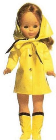
BAJO LA LLUVIA (N° 5). Impermeable, pañuelo y botas, en vistosos colores, propios para la lluvia y días grises.