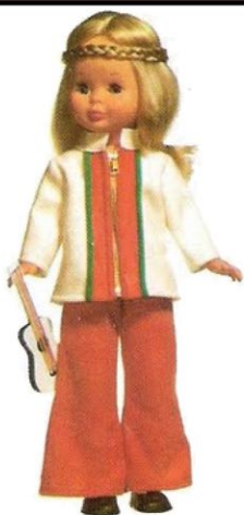
CON LOS AMIGOS (N° 6). Conjunto muy práctico para campo-montaña: pantalones largos de pana, chaquetón de fieltro y una guitarra.