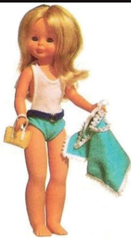
EN LA PLAYA (N° 9). Alegre bañador, poncho, sandalias y un cestito. Conjunto muy indicado para pasar un día junto al mar.