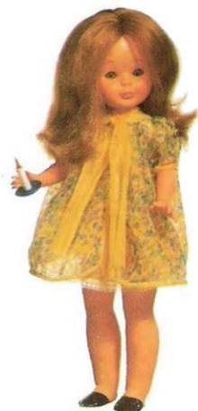
BUENAS NOCHES (N° 8). Camisón y salto de cama en fina lencería, babuchas y gracioso detalle de palmaria.