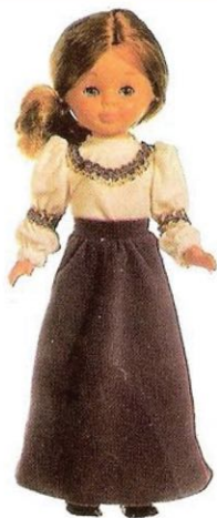
GRAN FANTASIA (N° 24). Dos piezas que se complementan y forman el conjunto ideal para una fiesta de cualquier época.