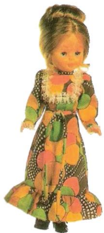
VESTIDO MAXI (N° 29). Por su actualidad y gracia resulta una delicia llevarla a todas las horas.