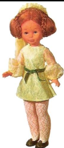
CEREMONIA (N° 16). Como su nombre indica, este modelo, todo bordado, lo lucirá Nancy en los más fantásticos momentos. Lo acompaña un gracioso tocado de cabeza.