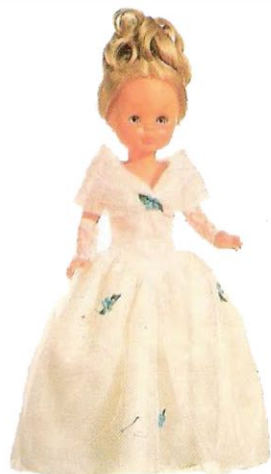
ESPERANDO AL PRINCEPE (N° 26). Traje de noche como en los cuentos de hadas; para salón o para baile de disfraces.