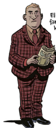
Eliot Rosewater: fan millonario de Kilgore Trout.

Y si alguna vez pasas por Cody (Wyoming), tú pregunta por Wild Bob.