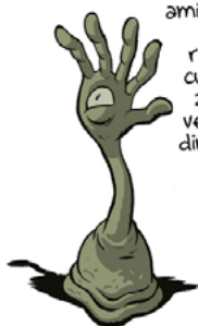
Trafamadorianos: alienígenas telepáticos y amistosos de aspecto ridículo que custodian un zoológico y ven en cuatro dimensiones.