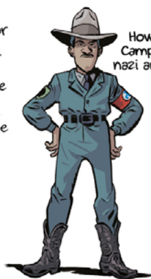
Howard W. Campbell, Jr.: nazi americana.