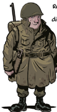
Roland Weary: gordo de dieciocho años, estúpido, malicioso, impopular e infeliz, obsesionado con la gloria.