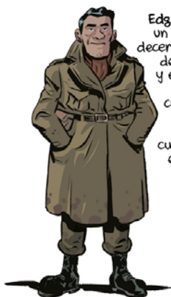
Edgar Derby: un hombre decente, profesor de instituto y entrenador de tenis, cuya muerte supone el momento culminante de este libro.