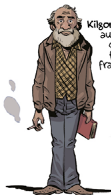
Kilgore Trout: autor de ciencia ficción fracasado.