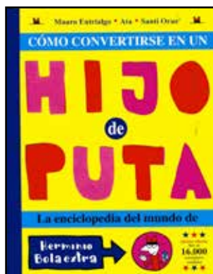
Cómo convertirse en un hijo de puta 80 páginas. 12 euros ISBN: 978-84-935088-7-6