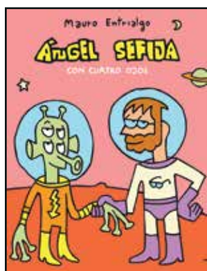
Ángel Sefija con cuatro ojos 80 páginas. 12 euros ISBN: 978-84-96815-42-1