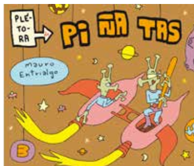
Plétora de piñatas 3 128 páginas. 17 euros ISBN: 978-84-15685-14-2