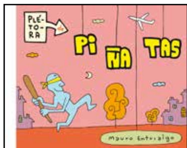
Plétora de piñatas 1 128 páginas. 17 euros ISBN: 978-84-15163-47-3