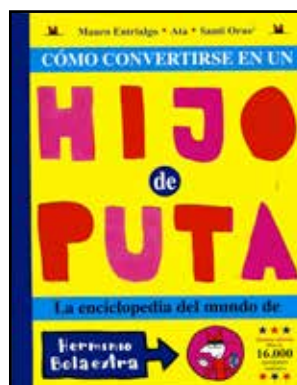
Cómo convertirse en un hijo de puta 80 páginas. 12 euros ISBN: 978-84-935088-7-6