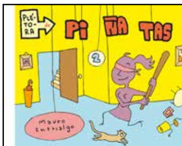
Plétora de piñatas 2 128 páginas. 17 euros ISBN: 978-84-15163-89-3