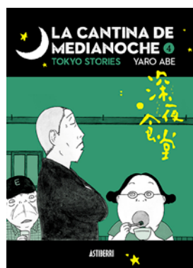
La cantina de medianoche 4 296 páginas. 18 euros ISBN: 978-84-18215-53-7