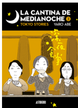
La cantina de medianoche 3 296 páginas. 18 euros ISBN: 978-84-17575-91-5