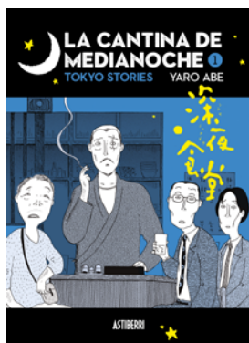
La cantina de medianoche 1 2.ª edición 296 páginas. 18 euros ISBN: 978-84-17575-24-3