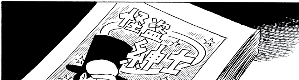
PORTADA: EL LADRÓN CABALLERO.