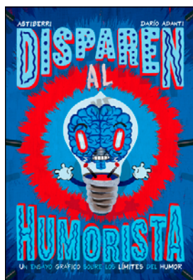
Dispáren al humorista 2. a edición 160 páginas. 17 euros ISBN: 978-84-16251-94-0