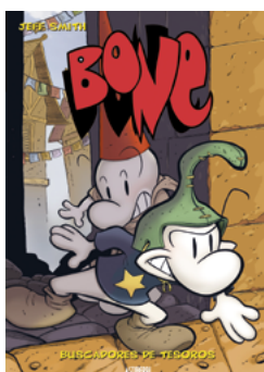
BONE 8 Buscadores de tesoros 144 páginas. 15 euros ISBN: 978-84-96815-73-5