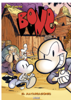
BONE 4 El matadragones 180 páginas. 20 euros ISBN: 978-84-96815-28-5