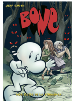
BONE 3 Los ojos de la tormenta 192 páginas. 18 euros ISBN: 978-84-93538-56-9