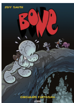
BONE 7 Círculos fantasma 160 páginas. 15 euros ISBN: 978-84-96815-68-1