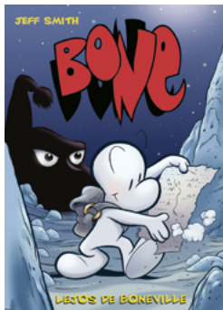
BONE 1 Lejos de Boneville 144 páginas. 17 euros ISBN: 978-84-93508-89-0