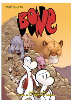
BONE 5 Rock Jaw Señor de la frontera oriental 128 páginas. 15 euros ISBN: 978-84-96815-37-7