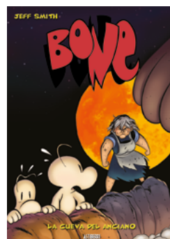
BONE 6 La cueva del anciano 128 páginas. 15 euros ISBN: 978-84-96815-50-6