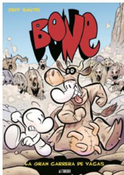
BONE 2 La gran carrera de vacas 144 páginas. 17 euros ISBN: 978-84-93538-50-7