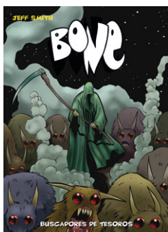
BONE 8 Buscadores de tesoros 144 páginas. 9 euros ISBN: 978-84-15163-01-5