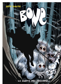
BONE 6 La cueva del anciano 128 páginas. 9 euros ISBN: 978-84-92769-86-5