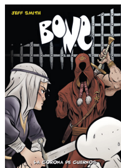
BONE 9 La corona de cuernos 224 páginas. 9 euros ISBN: 978-84-15163-21-3