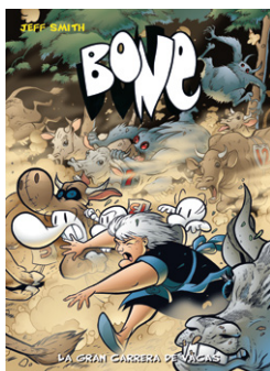
BONE 2 La gran carrera de vacas 2.ª edición 144 páginas. 9 euros ISBN: 978-84-92769-52-0