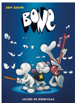
BONE 1 Lejos de Boneville 4.ª edición 144 páginas. 11 euros ISBN: 978-84-92769-47-6