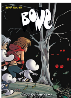
BONE 7 Círculos fantasma 160 páginas. 9 euros ISBN: 978-84-15163-00-8