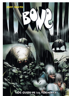
BONE 3 Los ojos de la tormenta 192 páginas. 9 euros ISBN: 978-84-92769-60-5