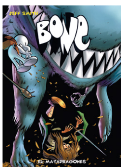
BONE 4 El matadragones 180 páginas. 9 euros ISBN: 978-84-92769-61-2