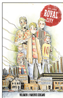
Royal City 1 Familia directa Jeff Lemire 160 páginas. 18 euros ISBN: 978-84-17575-34-2