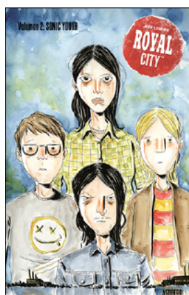
Royal City 2 Sonic Youth 136 páginas. 18 euros ISBN: 978-84-17575-58-8