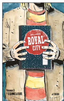
Royal City 3 Y seguimos a flote 120 páginas. 18 euros ISBN: 978-84-18215-03-2