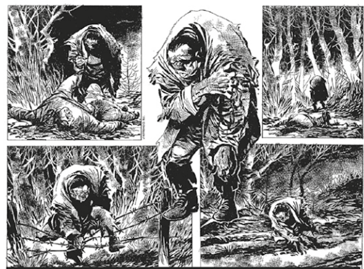
También es válido el recurso de crear una figura dominante entre viñetas, para destacarla como recurso dramático; página perteneciente a la serie Monster, publicada en la antología de cómics de terror británica Scream! (Fleetway, 1984), con guión de John Wagner y dibujos de Redondo

La viñeta va "enmarcada" por una línea continua, pero en ocasiones podemos cambiar esta forma para ayudarnos en lo que narramos. En una viñeta de "tiempo pasado" podemos eliminar el "marco", estableciendo así una diferencia con la narración del presente. Aunque también podemos hacerlo sencillamente por estética compositiva o por dar "libre espacio" al contenido. También podemos hacer la línea del enmarcado discontinua, con ese mismo objetivo.