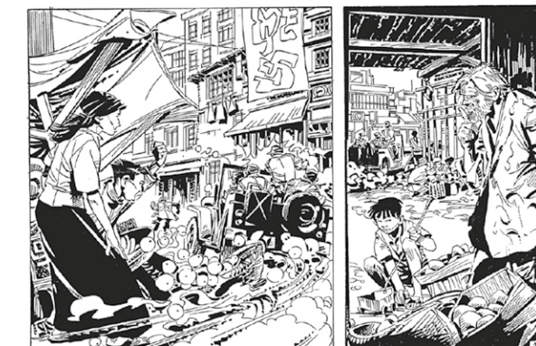
Página de dos tiras para desarrollar mejor las viñetas de acción; pertenece a la serie inédita Pipo (años ochenta) y fue dibujada por Redondo