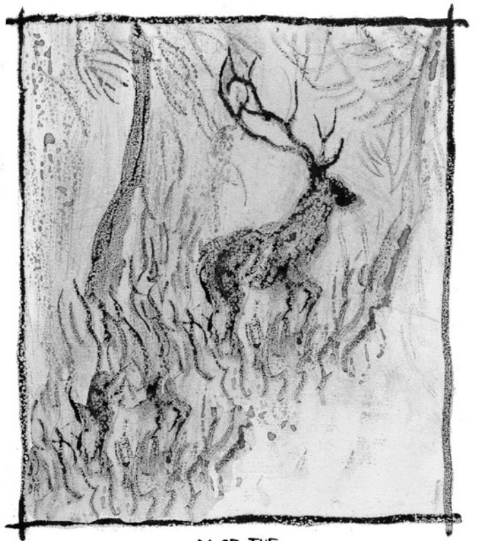
Y SE FUE