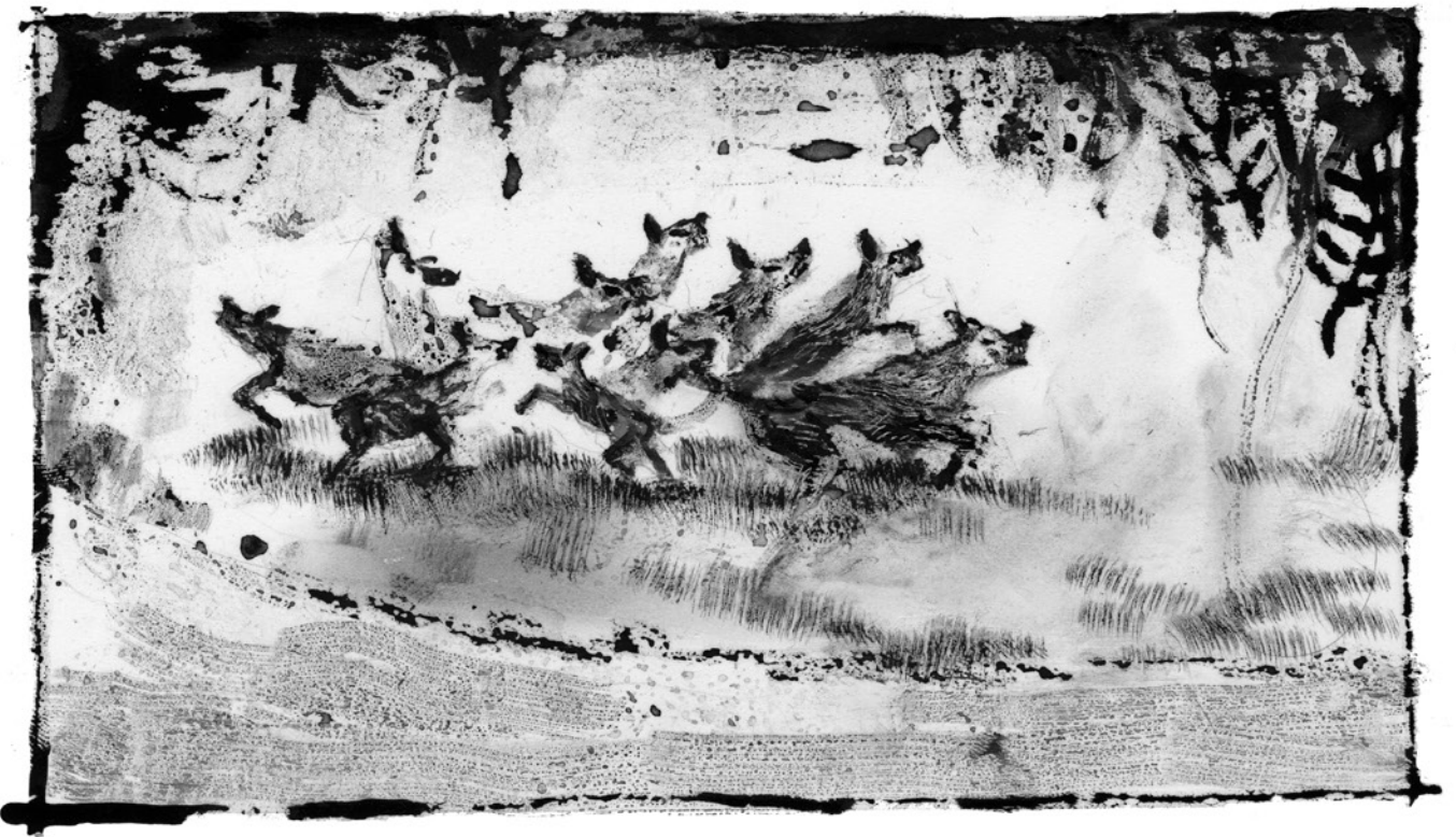
LOS PERROS HAMBRIENTOS CORRÍAN EN CÍRCULOS, SALIVANDO Y AULLANDO POR LA MUERTE DE UN HERMANO