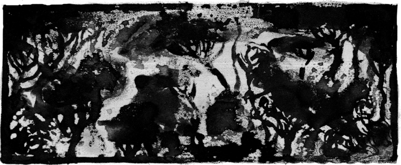
LA HUMEDAD SOFOCANTE