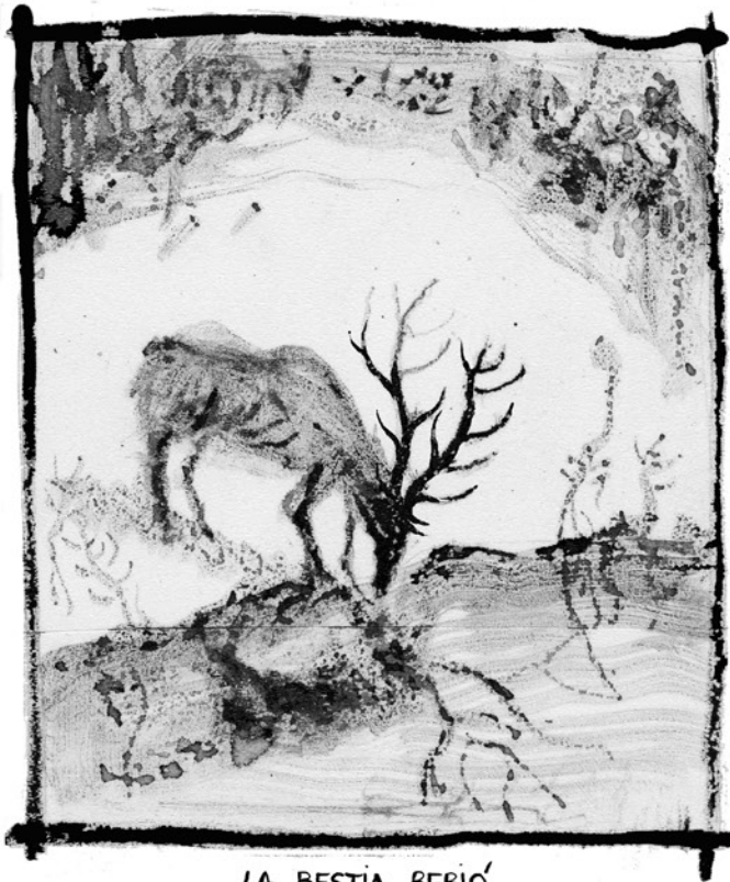
LA BESTIA BEBIÓ