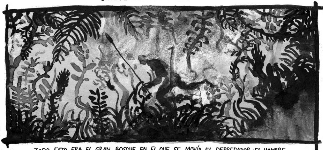
TODO ESTO ERA EL GRAN BOSQUE EN EL QUE SE MOVÍA EL DEPRADOR: EL HOMBRE