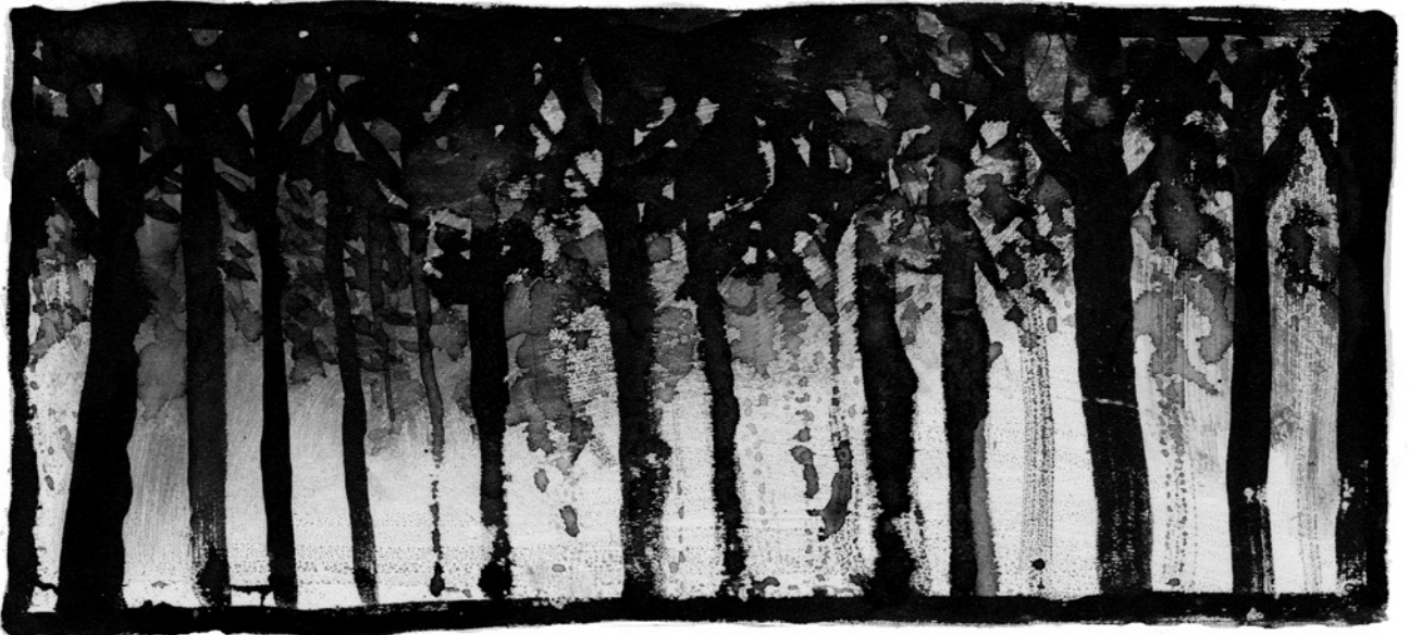
EL AIRE ESTANCADO