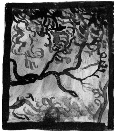
SIEMPRE PELIGRO, EN ALERTA