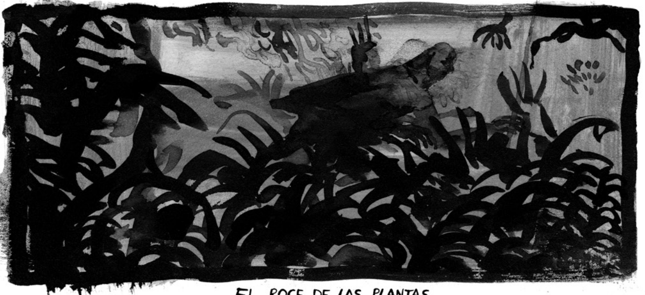
EL ROCE DE LAS PLANTAS