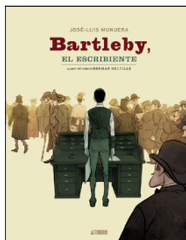
Bartleby, el escribiente 80 páginas. 18 euros ISBN: 978-84-18215-55-1