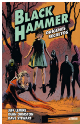
Black Hammer. Tomo 1 Orígenes secretos 3.ª edición

Jeff Lemire, Dean Ormston 184 páginas. 19 euros ISBN: 978-84-16880-21-8