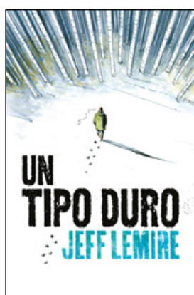
Un tipo duro Jeff Lemire, 272 páginas. 26 euros ISBN: 978-84-16880-70-6