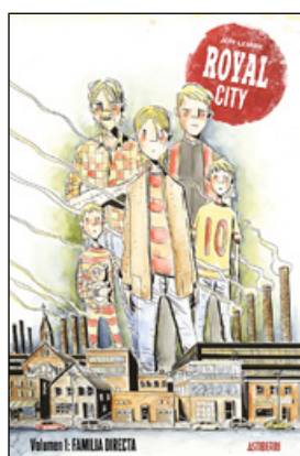
Royal City 1 Familia directa Jeff Lemire 160 páginas. 18 euros ISBN: 978-84-17575-34-2