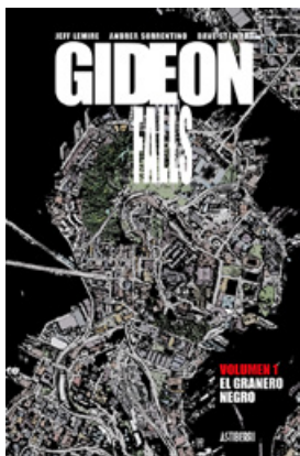
Gideon Falls 1 El granero negro 160 páginas. 18 euros ISBN: 978-84-17575-28-1