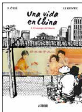
Una vida en China 3 El tiempo del dinero 272 páginas. 22 euros ISBN: 978-84-15163-19-0