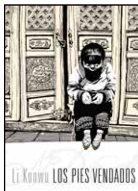
Los pies vendados 128 páginas. 14 euros ISBN: 978-84-15685-13-5