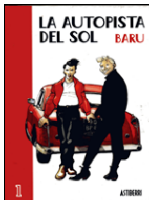
La autopista del sol 1 12 euros. 240 páginas ISBN: 978-84-95825-35-3