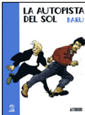
La autopista del sol 2 12 euros. 200 páginas ISBN: 978-84-95825-41-4