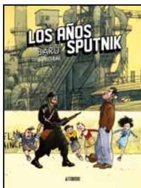
Los años Sputnik. Integral 25 euros. 208 páginas ISBN: 978-84-15685-24-1