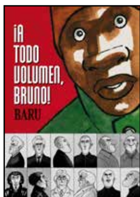
¡A todo volumen, Bruno! 16 euros. 128 páginas ISBN: 978-84-15163-32-9