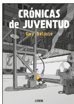
Crónicas de juventud 144 páginas. 16 euros ISBN: 978-84-18215-59-9