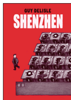
Shenzhen 6.ª edición 152 páginas. 18 euros ISBN: 978-84-935088-0-7