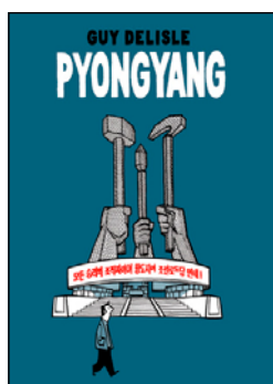
Pyongyang 13.ª edición 184 páginas. 18 euros ISBN: 978-84-96815-05-6