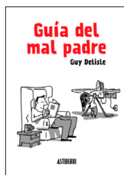
Guía del mal padre Tomo 1 4.ª edición 192 páginas. 12 euros ISBN: 978-84-15685-09-8 Tomo 2 2.ª edición 192 páginas. 12 euros ISBN: 978-84-15685-56-2 Tomo 3 192 páginas. 12 euros ISBN: 978-84-15685-90-6 Tomo 4 192 páginas. 12 euros ISBN: 978-84-17575-00-7