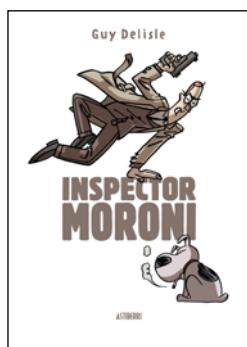
Inspector Moroni Edición integral 152 páginas. 20 euros ISBN: 978-84-15685-61-6