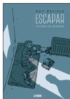
Escapar. Historia de un rehén 2.ª edición 432 páginas. 23 euros ISBN: 978-84-16251-75-9