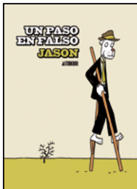
Un paso en falso 192 páginas. 17 euros ISBN: 978-84-15163-61-9