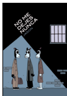
No me dejes nunca 48 páginas. 12 euros ISBN: 978-84-96815-34-6