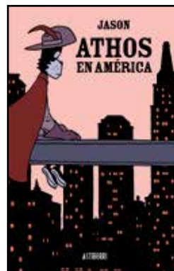
Athos en América 192 páginas. 22 euros ISBN: 978-84-15163-49-7