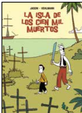
La isla de los cien mil muertos 56 páginas. 13 euros ISBN: 978-84-15163-96-1